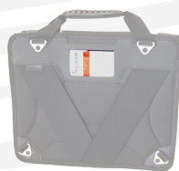
emplacement carte de visite