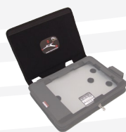
rabat de protection d'écran