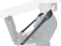
bandoulières de saisie

Les marques, les modèles et les brevets sont internationalement déposés par Mobilis®. Une partielle ou totale reproduction des produits Mobilis® est formellement interdite.