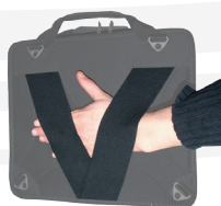
élastique de saisie