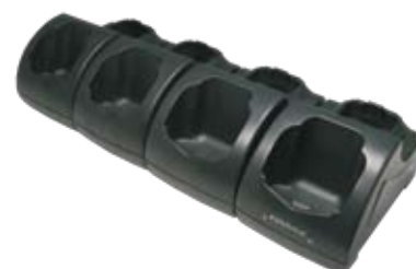
Puits/chargeur Ethernet 4 positions

Veillez vous référer au manuel utilisateur disponible sur www.mobile.datalogic.com/manuals pour les précautions d'emploi et les limites d'utilisation du produit. Pour toute information complémentaire sur ce produit et le téléchargement de logiciels, consultez le site: www.mobile.datalogic.com/datalogicJet